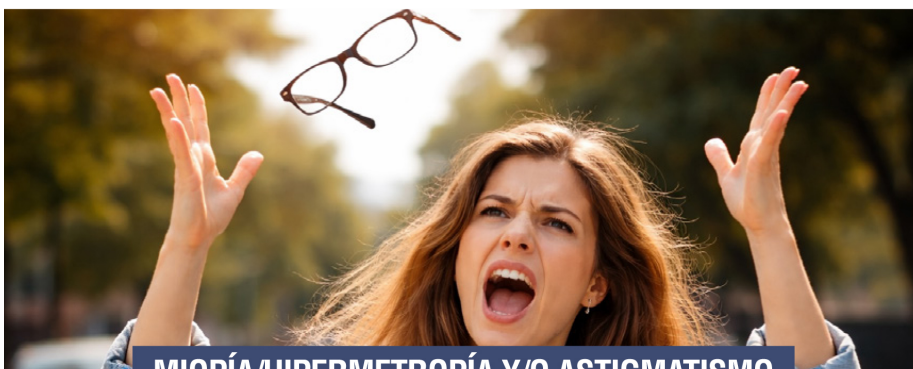
MIOPÍA/HIPERMETROPIA Y/O ASTIGMATISMO